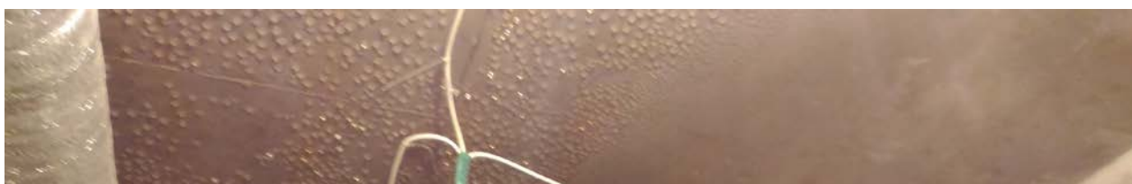
Монтаж системы приточно вытяжной вентиляции цокольного этажа.