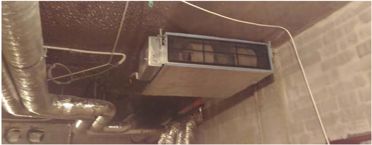
Ут епление перекрыт ия цокольного эт ажа