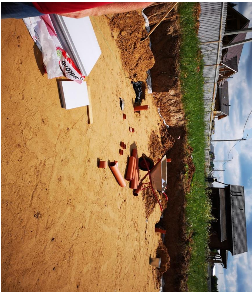
Устройство закладных деталей под инженерные сети