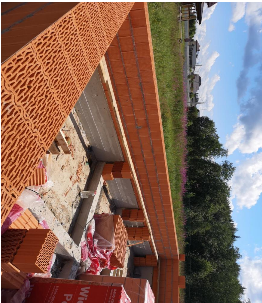
Кладка кирпичных стен из блоков "Поротерм"