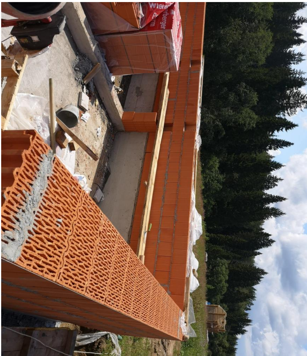
Кладка кирпичных стен из блоков "Поротерм"