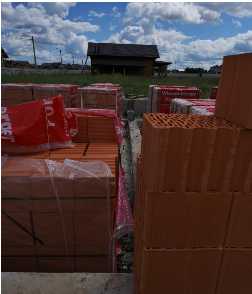
Раскладка блоков поротерма