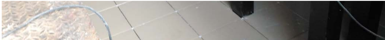
Монтаж контура теплых полов.