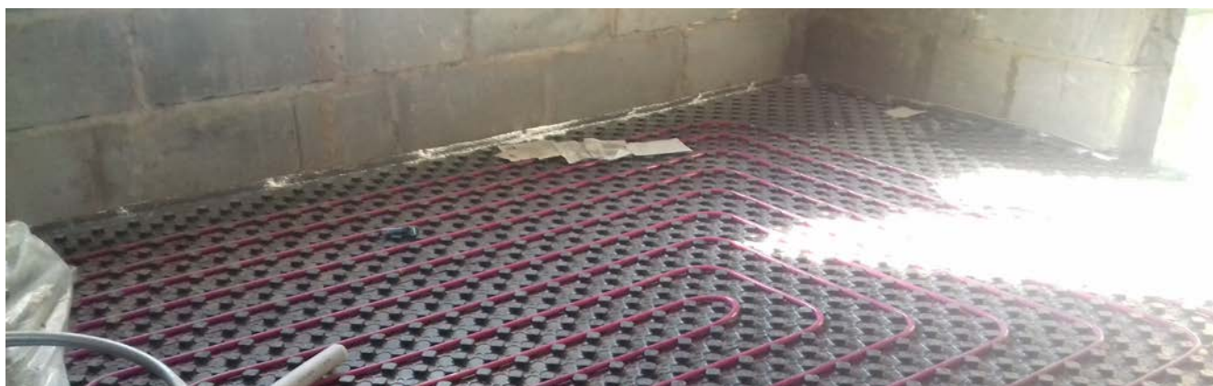
Монтаж теплых полов