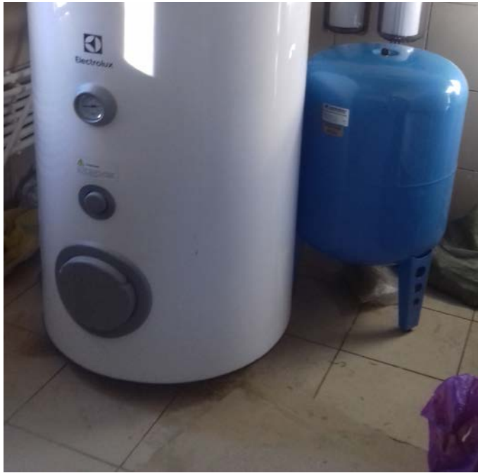
Окончание работ по обвязке оборудования в котельной