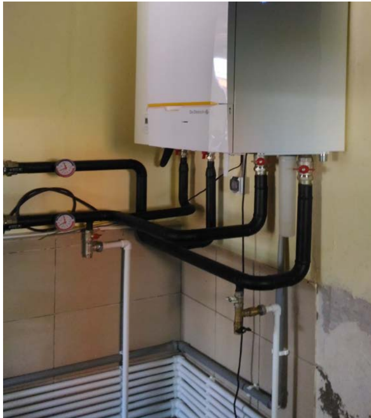
Опрессовка системы теплых полов