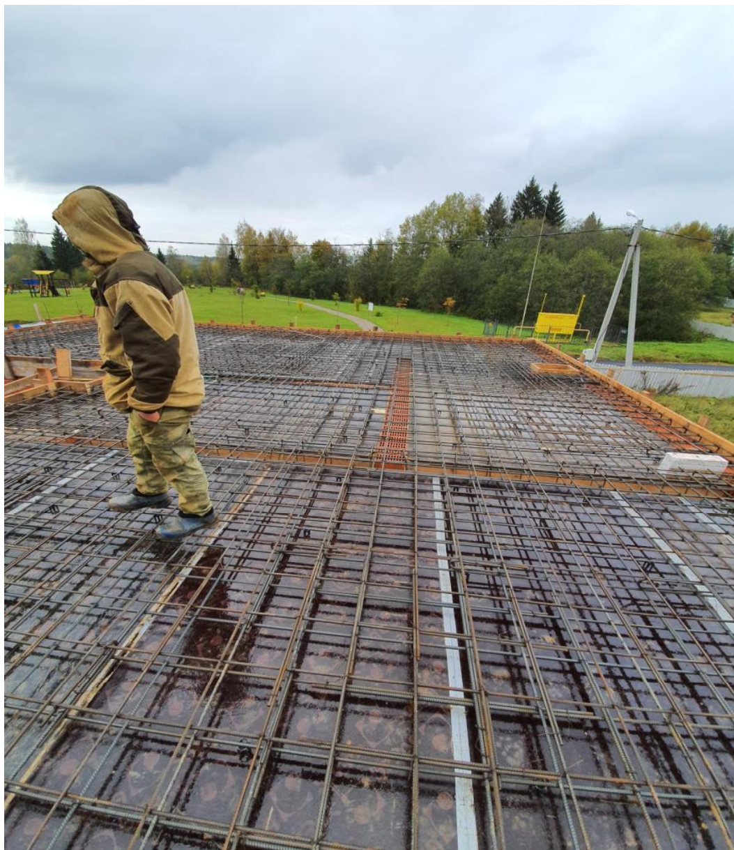
Армирование каркаса плиты перекрытия 1-го этажа