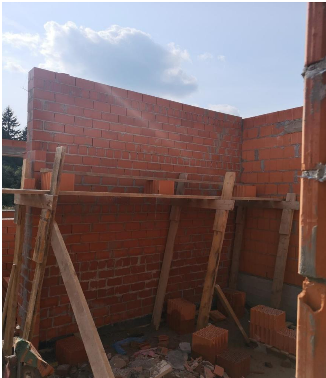
Кирпичная кладка внутренних стен