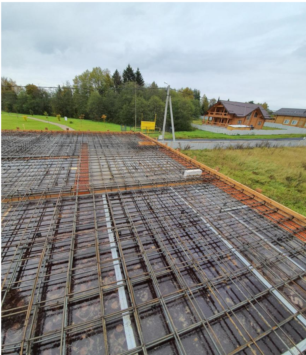
Армирование каркаса плиты перекрытия 1-го этажа