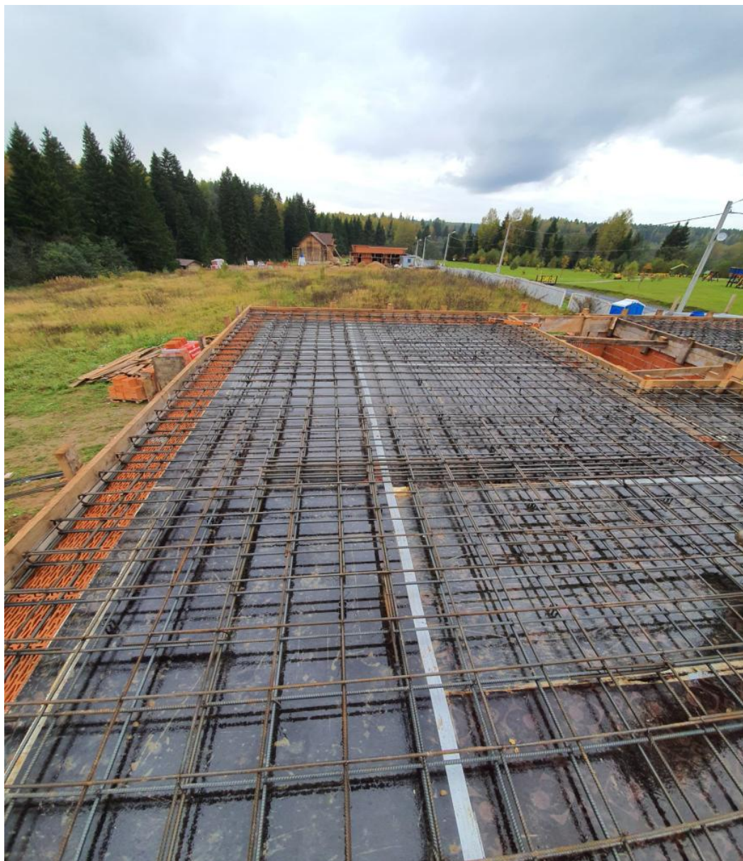
Армирование каркаса плиты перекрытия 1-го этажа