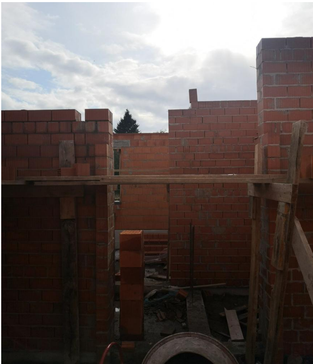
Кирпичная кладка внутренних стен