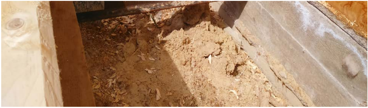
Пороки древесины на балочных элементах