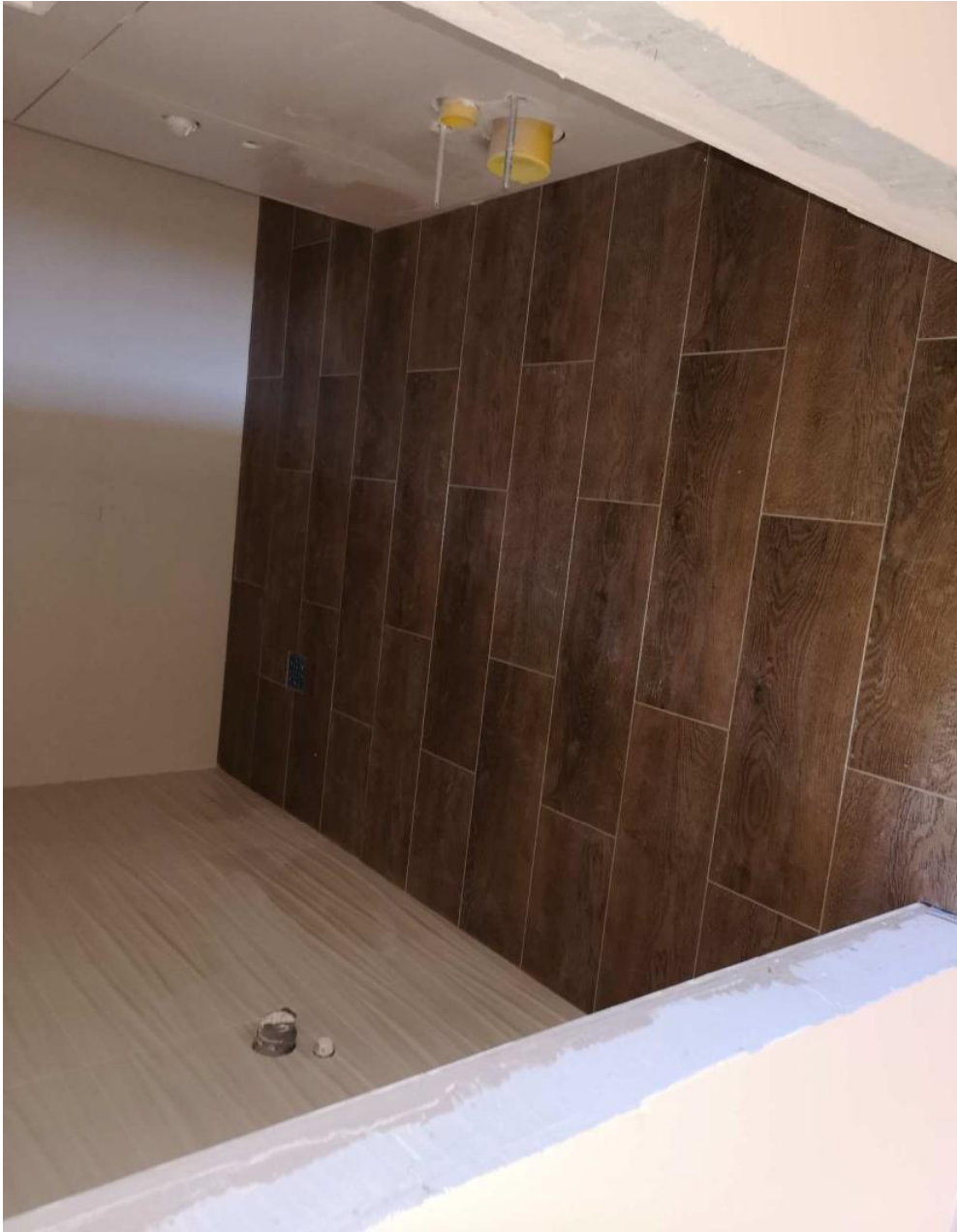
Плитка в с\у 1-го этажа.