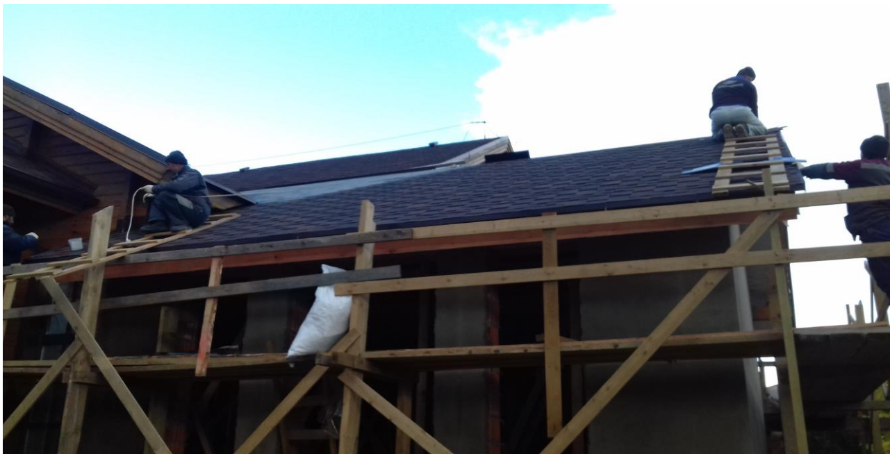
Монтаж балочной системы кровли