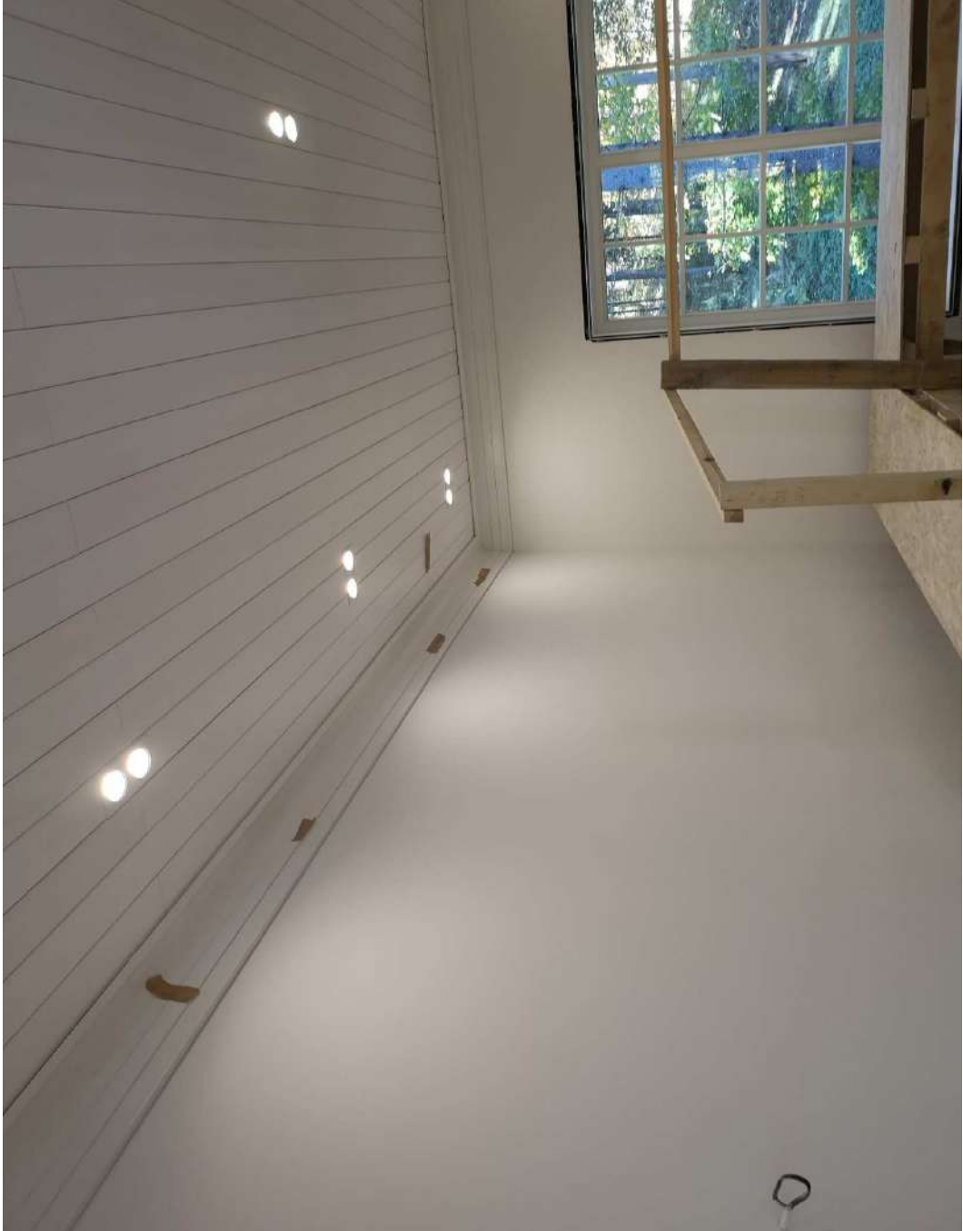
Обои в каминной.