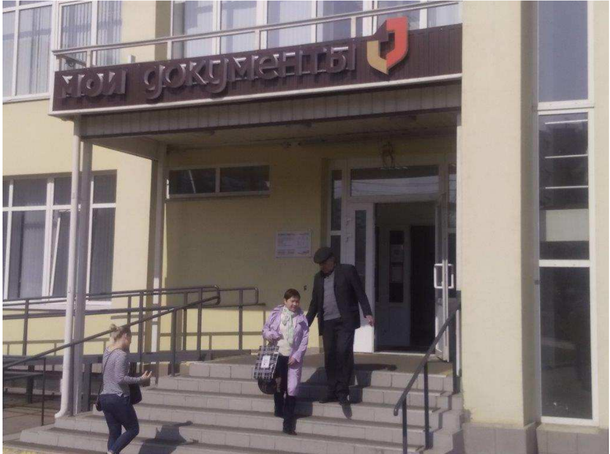
Общий вид 2.