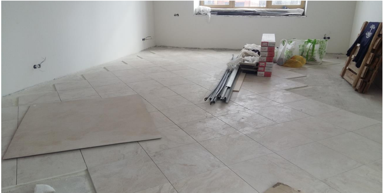
Внутренняя отделка стен и потолков