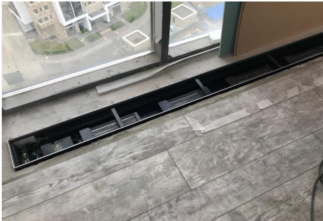
Укладка керамогранитной плитки, 08.06.2018.