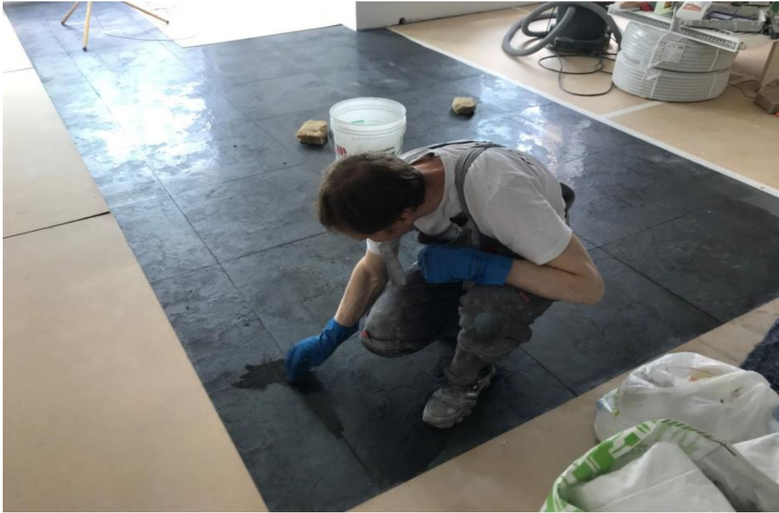
Затирка и отмывка керамогранитной плитки, 27.06.2018.