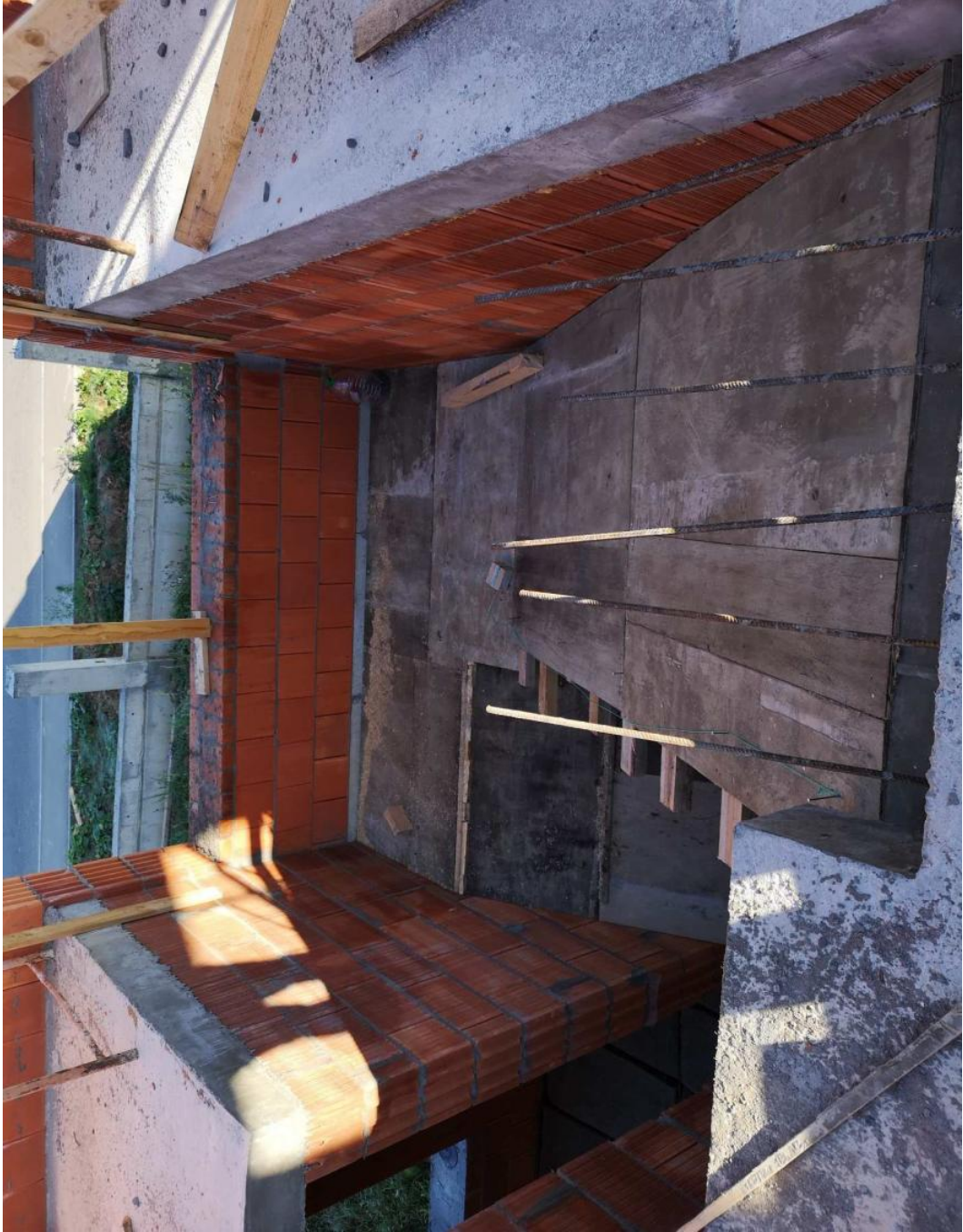
Монтаж опалубки лестницы.