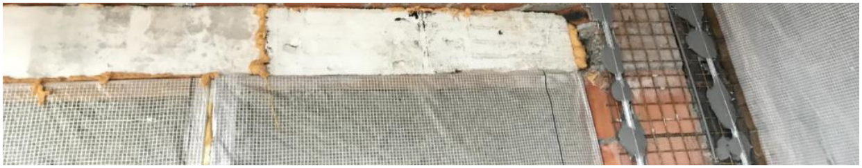
Устройство технологических отверстий для инженерных разводок.