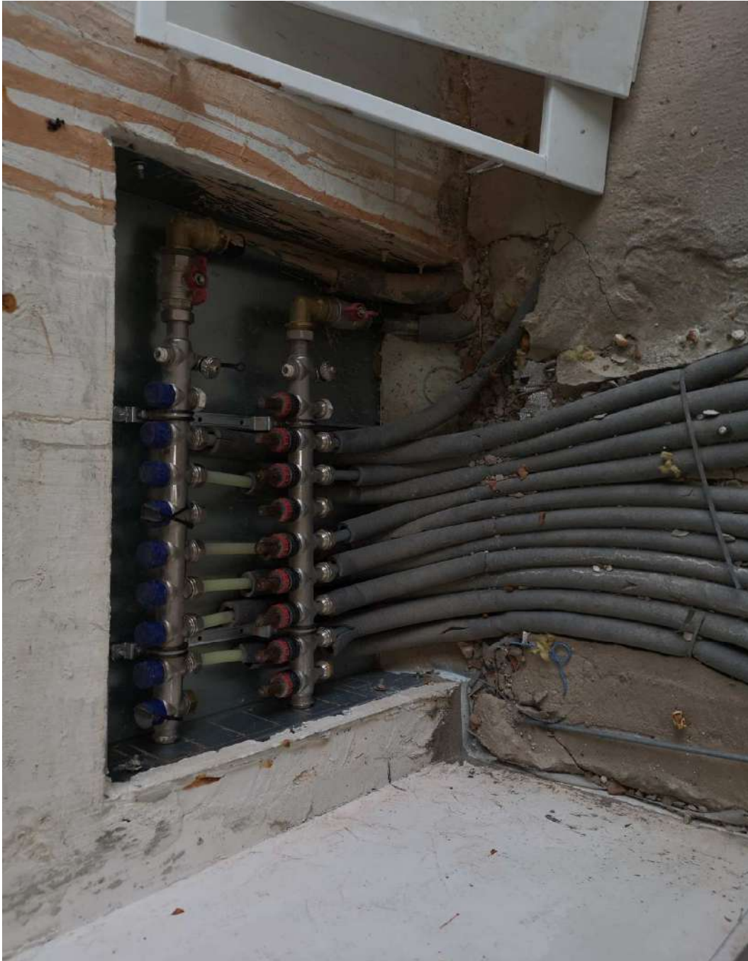
Коллектор системы отопления.