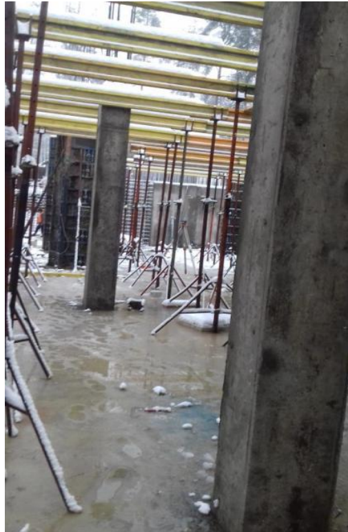
Монтаж опалубки перекрытия