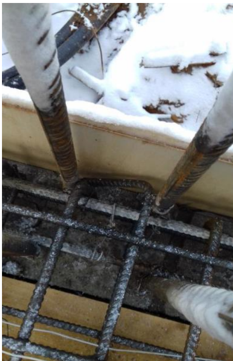
Не обеспечен защитный слой бетона