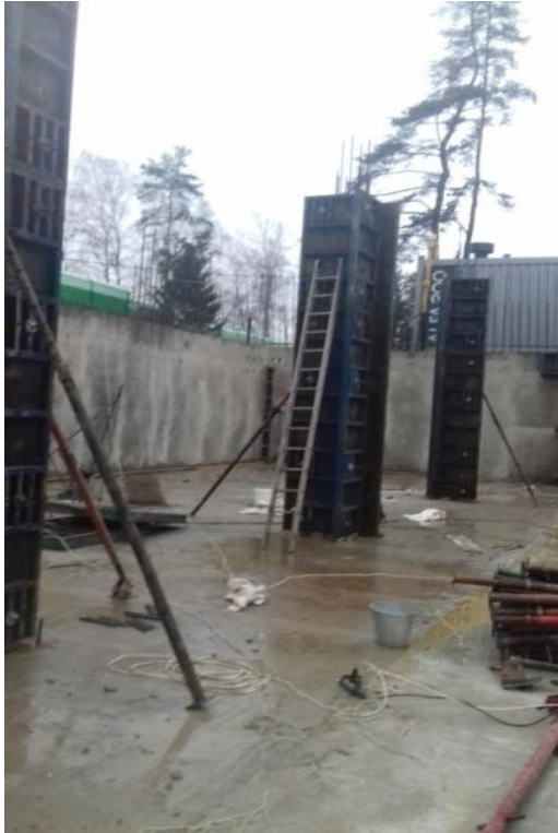
Монтаж опалубки колонн