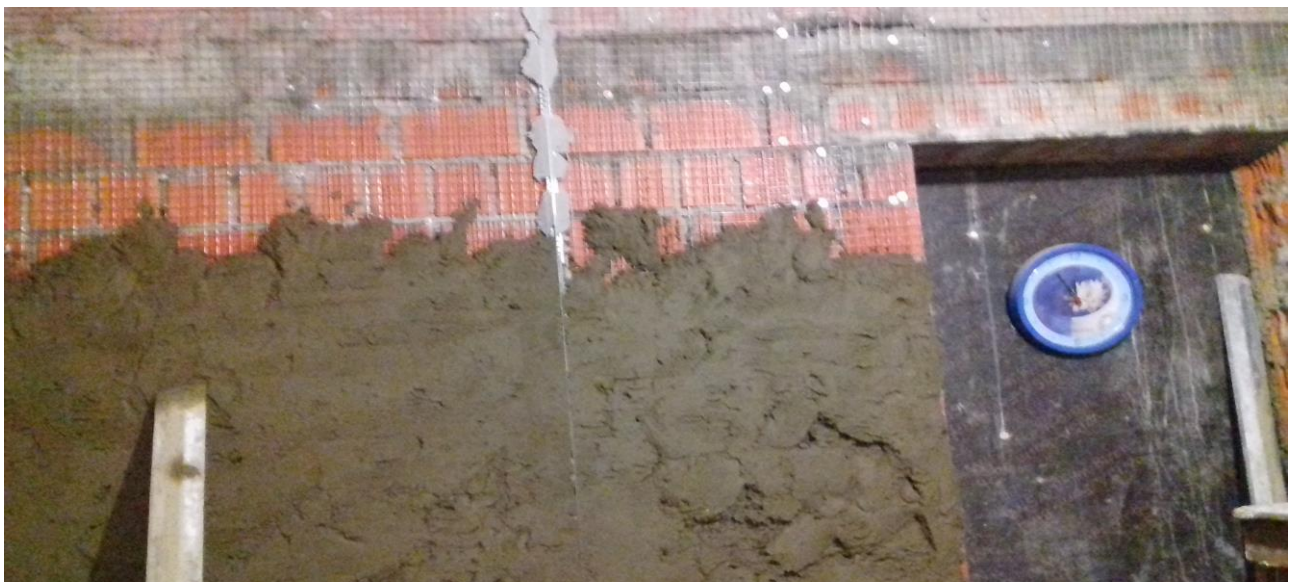
Штукатурка стен подвала